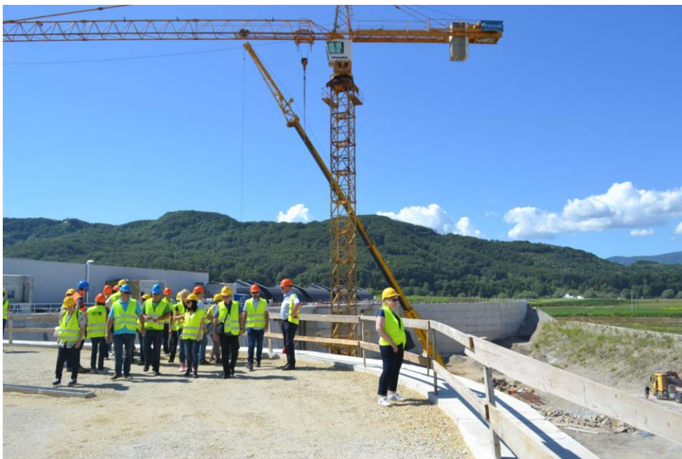
Strokovna ekskurzija - ogled gradbišča HE Brežice 18. junija 2016