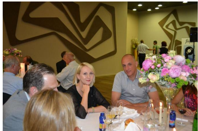
7. posvetovanje slovenskih geotehnikov - udeleženci